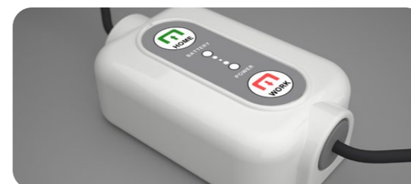
COMMUNICATION BOX COMMUNICATION BOX

per far lavorare NEMH 2 O sulle pareti lisce to make NEMH 2 O work on smooth surfaces