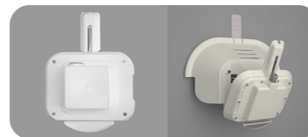
RICARICA A PENDOLO PENDULUM BATTERY CHARGE

per piscine in fase di costruzione for pool under construction