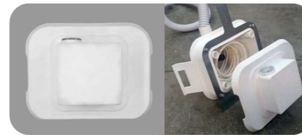
RICARICA FISSA ESTRAIBILE FIXED REMOVABLE BATTERY CHARGE

per piscine in fase di costruzione for pool under construction